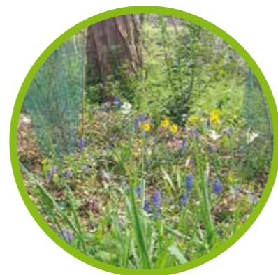
Embellir les espaces