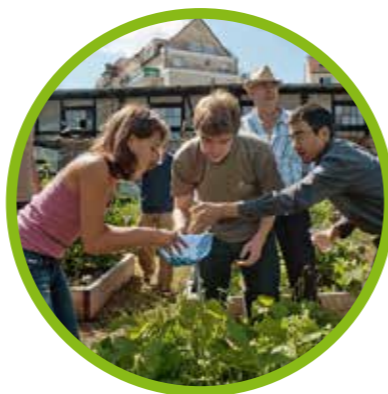
Favoriser le lien social