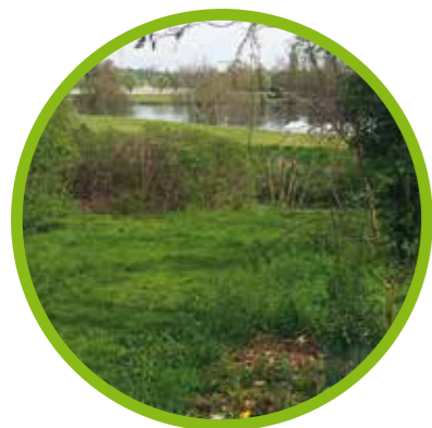
Redéfinir les usages