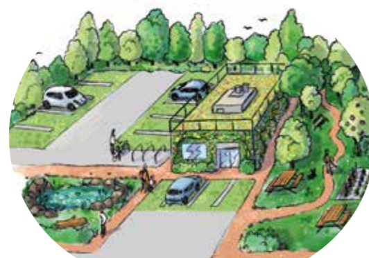
ÉTAT RÉALISÉ FINAL