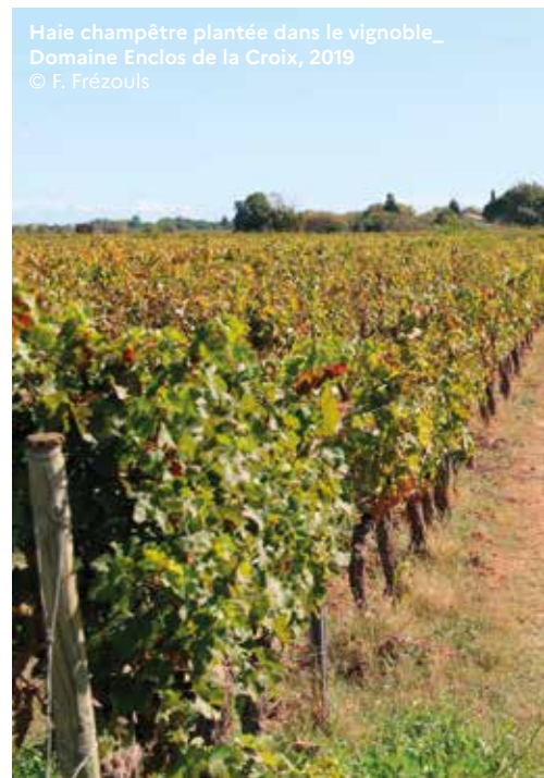
Haie champêtre plantée dans le vignoble_ Domaine Enclos de la Croix, 2019

La conception et la mise en œuvre du projet ont été assurées par les propriétaires du Domaine. Sur le long terme, la gestion, l'entretien et le suivi des plantations sont également pris en charge par l'Enclos de la Croix. Pour mettre en œuvre les travaux de plantations, le Domaine s'est appuyé sur neuf salariés à temps plein et a reçu le soutien de nombreux bénévoles. Le Domaine est par ailleurs soutenu par CDC Biodiversité via le programme Nature 2050 pour la définition et le suivi des indicateurs jusqu'en 2050, et son partenaire SAALTUS, mandaté pour réaliser le suivi technique. Le Domaine est aussi accompagné par le cabinet Forêt Ressources Management sur l'amélioration de la performance de stockage de carbone des plantations et le Centre de recherche de la Tour du Valat pour un suivi ornithologique. En parallèle, Pur Projet assure le suivi des lauréats du concours Arbres d'Avenir pendant les trois premières années.